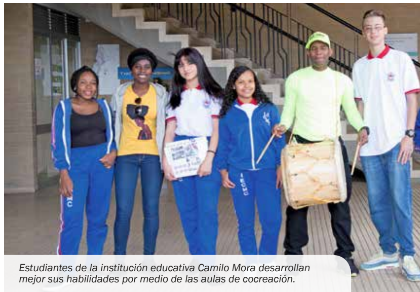
Estudiantes de la institución educativa Camilo Mora desarrollan mejor sus habilidades por medio de las aulas de cocreación.

Detrás de la cifra de 310 105 niños, jóvenes y adultos matriculados en instituciones educativas oficiales de Medellín, la más alta de los últimos cuatro años (en 2015 eran 305 768 alumnos), hay toda una revolución cuyo objetivo es salirse del esquema tradicional y formar ciudadanos integrales, capaces de afrontar los retos del siglo XXI.