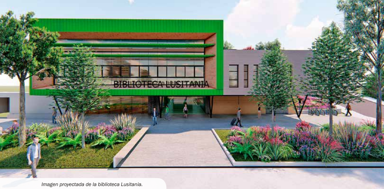
Imagen proyectada de la biblioteca Lusitania.