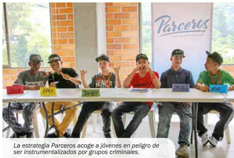
La estrategia Parceros acoge a jóvenes en peligro de ser instrumentalizados por grupos criminales.

1200 jóvenes serán formados en saberes durante 2019 con el programa Parceros .